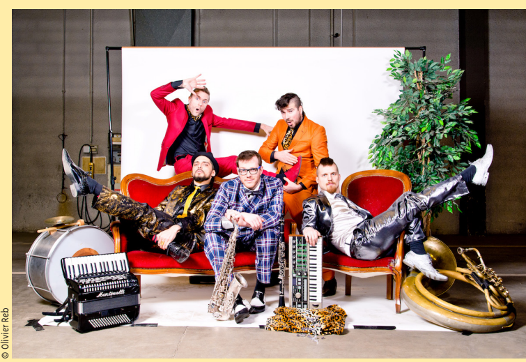
Amoureuse des musiques de l'est, klezmer et balkaniques, empreinte d'une énergie nucléaire mâtinée d'un humour fin et spirituel, la fanfare Couche-Tard embarque les spectateurs dans une frénésie de rythmes dansants

Grand jeu en après-midi, puis repas, concert avec la fanfare Couche-Tard