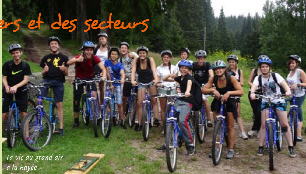
La vie au grand air à la Rayée

Si vous souhaitez mettre en place un projet en direction de la jeunesse, n'hésitez pas à interroger la commission Jeunesse-Vacances de la Fédé. Il n'est jamais trop tôt pour préparer et partager idées et expériences.